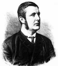
Wekerle Sándor (1848-1921)

Mór város neves szülöttje, hazánk történelmének egyik legkiemelkedőbb alakja, Wekerle Sándor háromszoros miniszterelnök és számtalan miniszteri poszt betöltője halálának 90. évfordulója tiszteletére a 2011-es évet Mór Város Önkormányzata „ Wekerle Sándor Emlékévvé ” nyilvánította. Az emlékév fővédnökségét Orbán Viktor miniszterelnök vállalta fel.