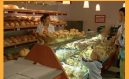
A Takács pékség a Deák és Petőfi utca sarkán –hirdetés–