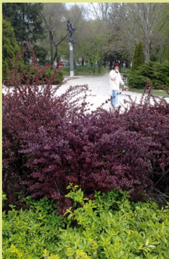
Visszatértek a színek a világunkba