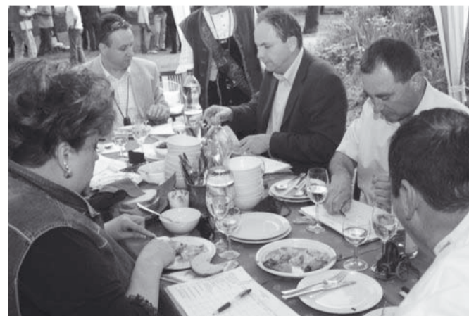
A zsűri munka közben

A Szent György-hétnek mindig kiemelt jelentőségű eseménye a borral készülő ételek országos főzőversenye, amely a hangzatos „Ezerjő Fakanálforgató” nevet kapta. Április 27-én délelőtt elég volt az orrát követnie annak, aki finom ételeket akart kóstolni: a Polgármesteri Hivatal előtti parkban rotyogtak a különféle pörköltök, egyéb mártásos húsok, ragulevesek és társaik. Közös vonásuk: mindegyikben volt bor. Ezen túl már csak a fantázia szabhatott határt az alkotásnak, hiszen a versenyen kiíró móri Borbarát Hölgyek Egyesülete és a Radó Antal Könyvtár és Művelődési Központ nem határozott meg különleges feltételeket. Bár igaz: javasolták, hogy minden ételből legalább 20-30 adag készüljön a méretes bográcsokban, hiszen