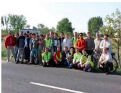
A tavasz és nyár egyik fontos kelléke a kerék- pár. A képen látható ke- rékpáros zarándoklatról júniusban bővebben közlünk információkat.